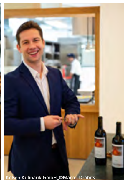
Kelsen Kulinarik GmbH_©Marcel Drabits