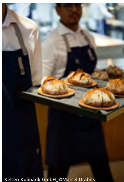
Kelsen Kulinarik GmbH