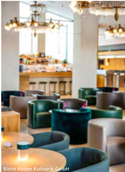
Bistro Kelsen Kulinarik GmbH