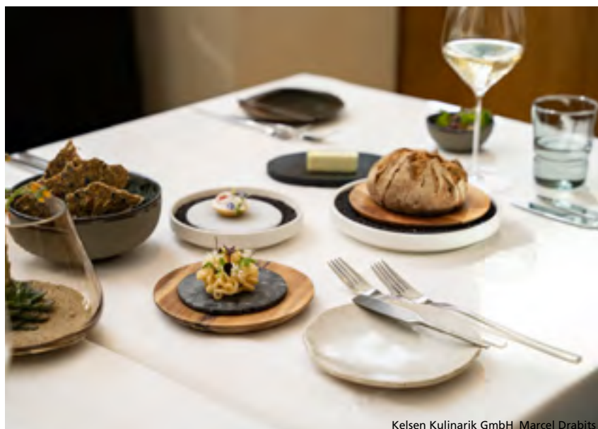
Kelsen Kulinarik GmbH_Marcel Drabits

„Ich schätze besonders die gute Zusammenarbeit sowie die professionelle und schnelle Betreuung des Supports.“